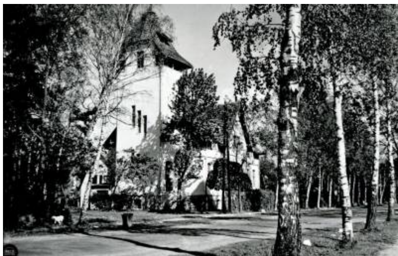
Dom Wczasowy „Nysa” (1968)

1968 - Na podstawie § 1 Rozporządzenia Prezesa Rady Ministrów z dnia 18 lipca 1968 r. w sprawie zmiany granic miasta Łeby w powiecie lęborskim, województwie gdańskim „Z miasta Łeby w powiecie lęborskim, województwie gdańskim wyłącza się miejscowości: Bryle, Lucin, Nowęcín, Żarnowska i włącza się je do gromady Wicko w tymże powiecie i województwie”