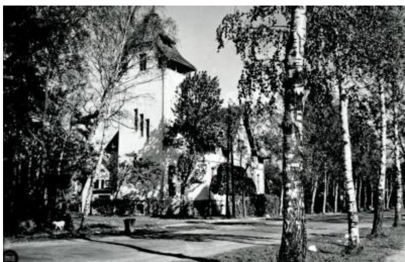
Dom Wczasowy „Nysa” (1968)

1968 - Na podstawie § 1 Rozporządzenia Prezesa Rady Ministrów z dnia 18 lipca 1968 r. w sprawie zmiany granic miasta Łeby w powiecie lęborskim, województwie gdańskim „Z miasta Łeby w powiecie lęborskim, województwie gdańskim wyłącza się miejscowości: Bryle, Lucin, Nowęcín, Żarnowska i włącza się je do gromady Wicko w tymże powiecie i województwie”